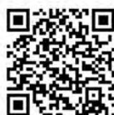
Телеграм канал "Клуб жилищных активистов"