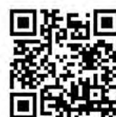
"Подкаст Просто о ЖКХ"